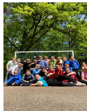
zoals spelletjes Bij het beauty