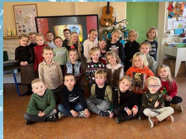
Kerstgroetjes van groep 2A

Wij wensen jullie een hele fijne Kerst en een heel gelukkig en gezond nieuwjaar!